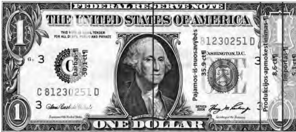
4 pav. 2013 m. maisto euras: 1 banknotas.