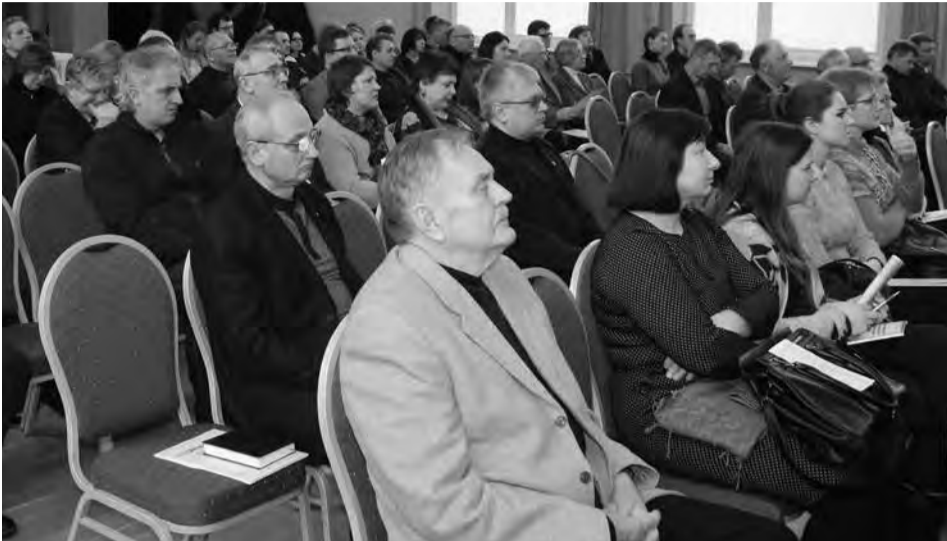
Konferencijos dalyviai Žemdirbystės institute