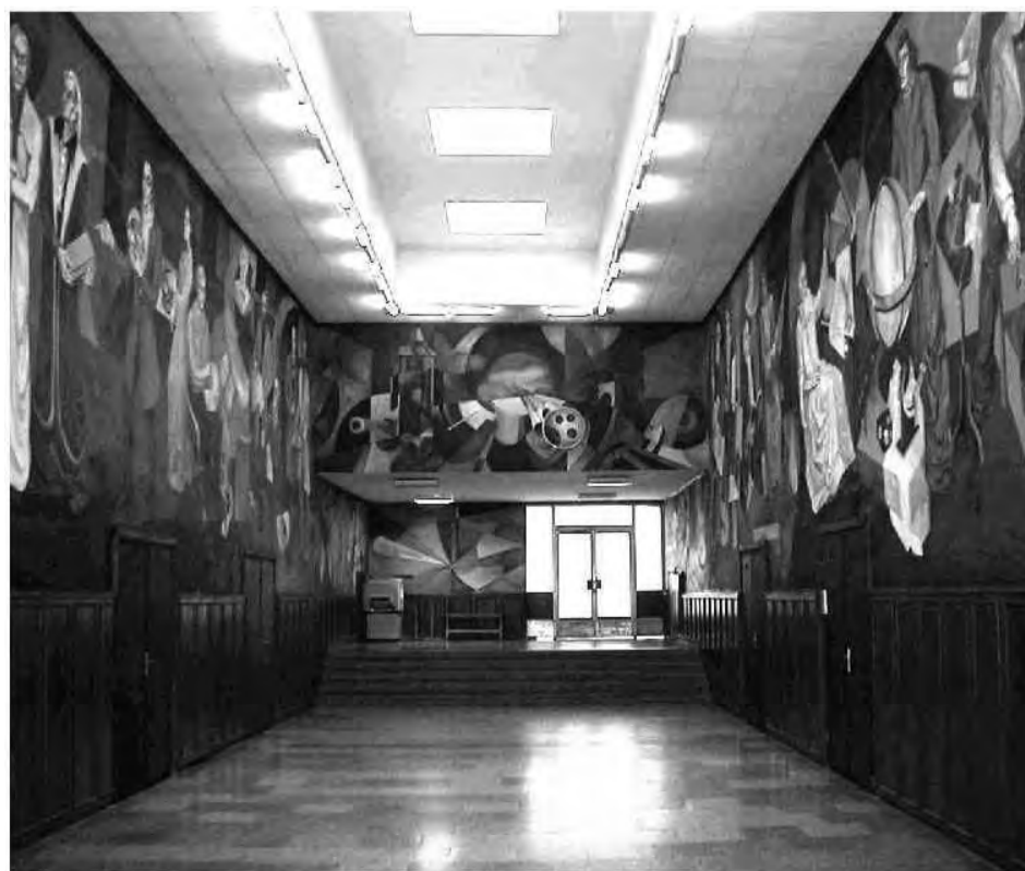
Freska „Forumas“. Autorius – dailininkas Valerijus Zubriakovas.

Atsižvelgiant į tai, kad nuo 2018 m. planuojama visiškai uždaryti LEU buvusį fizikos laboratorinį korpusą, nutraukiant jo eksploataciją, taip pat ir prieinamumą prie ten esančios freskų salės, alumnai pasiūlė šiame korpuse esamas laboratorijas ir patalpas pritaikyti mokslo edukacijos tikslais Lietuvos