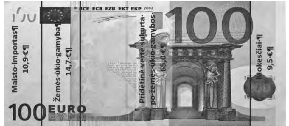
3 pav. 2015 m. maisto doleris: pagrindinių veiksmų banknotas (nominalus). Šaltinis: USDA ERS, 2017