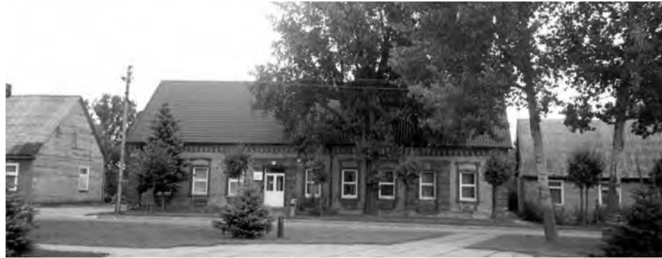
Simno ambulatorija. Tarpukariu buvo valsčiaus raštinė. Dešinėje pusėje buvusi Simno pradinė mokykla. 2016 m.