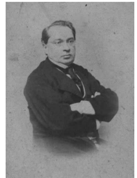
Archeologas, etnografas, istorikas Adomas Honorijus Kirkoras (1818 01 21 – 1886 11 23). Pažymime jo gimimo 200-ąsias metines

Prašome paremti Lietuvos mokslininkų sąjungą, skiriant 2 proc. pajamų mokesčio Lietuvos mokslininkų sąjungos veiklai: akademinės bendruomenės interesų gynimui, visuotiniam Lietuvos mokslininkų suvažiavimui, Pasaulio lietuvių mokslo ir kūrybos simpoziumui. Išsamią informaciją apie „Mokslo Lietuvos“ prenumeratą ir paramą Lietuvos mokslininkų sąjungai rasite laikraščio interneto svetainėje: http://mokslolietuva.lt/ .