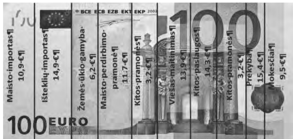
5 pav. 2013 m. maisto euras: 2 banknotas.

Autorė yra Lietuvos agrarinės ekonomikos instituto vyresnioji mokslo darbuotoja, „Mokslo Lietuvos“ redakcinės kolegijos narė