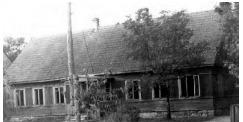
Simno pradinė mokykla 1939 m.

Daug dėmesio autorius skiria Simno apylinkėje veikusioms mokykloms, šiuo metu uždarytomis dėl mokinių stygiaus: Metelicos, Kavalčiukų, Gluosninkų pradinės mokyklos ir Ažuolinių, Mergalaukio, Verebiejų pagrindinės mokyklos, išaugusios iš pradinių. Tai rašytinis paminklas jau nebeesantioms mokykloms. Autorius valdingai paima skaitytą už rankos ir vedasi per šių mokyklų slenksčius, supažindindamas su jų vadovais, mokytojais, mokiniais.