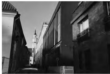
Kauno vaizdai.

– Pirmiausia miestą įgalina transportas, judėjimas. Istoriskai susiklostė, kad kažkada architektūros grandai matė automobilį kaip laisvės simbolį. Plačios gatvės ir pralaidumas buvo svarbiausia. Dabar situacija keičiasi.