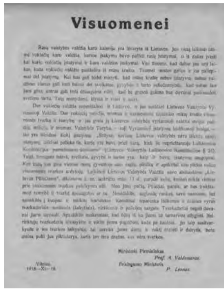
Atsišaukimas „Visuomenei“: gyventojams nurodoma laikytis rimties, telktis į savignyos būrius, padėti krašte įvesti tvarką. Pasirašė Ministras Pirmininkas Augustinas Voldemaras, teisingumo ministras Petras Leonas (Vilnius, 1918 11 18. LMAVB RSS, L-A/1931)

jų ypač įdomus vokiečių sudarytas Lietuvos srities žemėlapis. Jis labai smulkus, todėl visuomenė jame gali aptikti net savo kaimą ir sužinoti, kurioje apskrityje jis buvo. Parodai