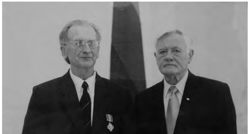
Po apdovanojimo (2008). Dešinėje: apdovanojimą profesoriui įteikęs Lietuvos Respublikos Prezidentas Valdas Adamkus