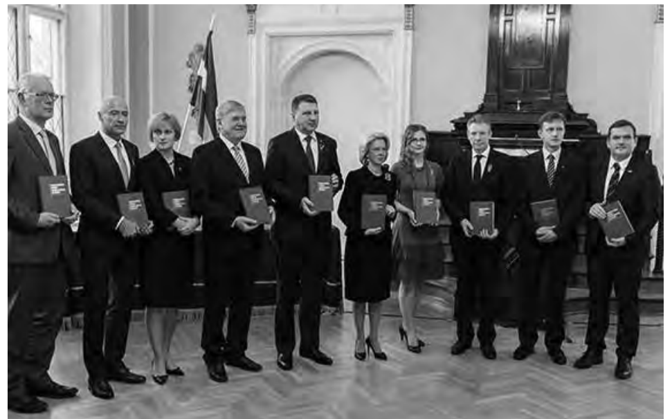
Monografijos apie valstybės tęstinumo doktriną Latvijos istorijos kontekste autorių pagerbimas

Pristatyta monografija apie valstybės tęstinumo doktriną Latvijos istorijos kontekste ( Nepārtrauktības doktrīna Latvijas vēstures kontekstā ), kurią, vykdydami ketverių metų trukusį tarpdisciplininį projektą, parengė 12 teisininkų, istorikų ir politologų, kuriems vadovavo akademikas Talavas Jundžis ( Tālavas Jundzīš ). Mokslininkai įrodė 1918 m. įkurtos Latvijos valstybės juridinį