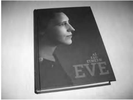
Knygos viršelis.

Sausio 18 d. Lietuvos mokslų akademijos įvyko knygos „Aš esu Etmės Evė. Ieva Simonaitytė amžininkų liudijimuose“ (2017) sutiktuvės. Pilnutėlėje LMA Didžiojoje sa-