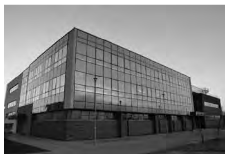
Naujasis Jūros tyrimų instituto mokslinių laboratorijų pastatas

Klaipėdos universiteto miestelyje mokslinių tyrimų laboratorijų pastatas pradėtas statyti 2016 m. birželio mėnesį, įgyvendinant Jūrinio slėnio branduolio kūrimo ir studijų infrastruktūros atnaujinimo projekto (JŪRA) II etapą. Pastato statyboms ir labo-