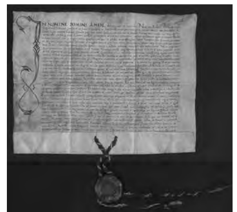
Rankraščio, rasto Vrublevskių bibliotekoje, faksimilė