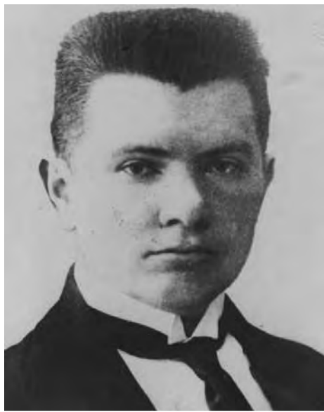
Augustinas Voldemaras (1883–1942). 1918 m. liepos 13 d. kooptuotas į Valstybės Tarybą, lapkričio 11 d. – gruodžio 26 d. vadovavo I Ministrų kabinetui, kartu ėjo užsienio reikalų ir krašto apsaugos ministrų pareigas. Lapkričio 23 d. pasirašė pirmąjį įsakymą dėl Lietuvos kariuomenės kūrimo.