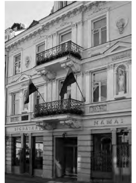
Signatarų namai Vilniuje