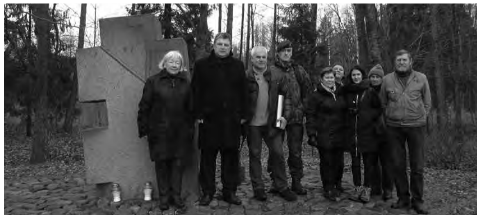
Prie paminklo laisvės kovotojams