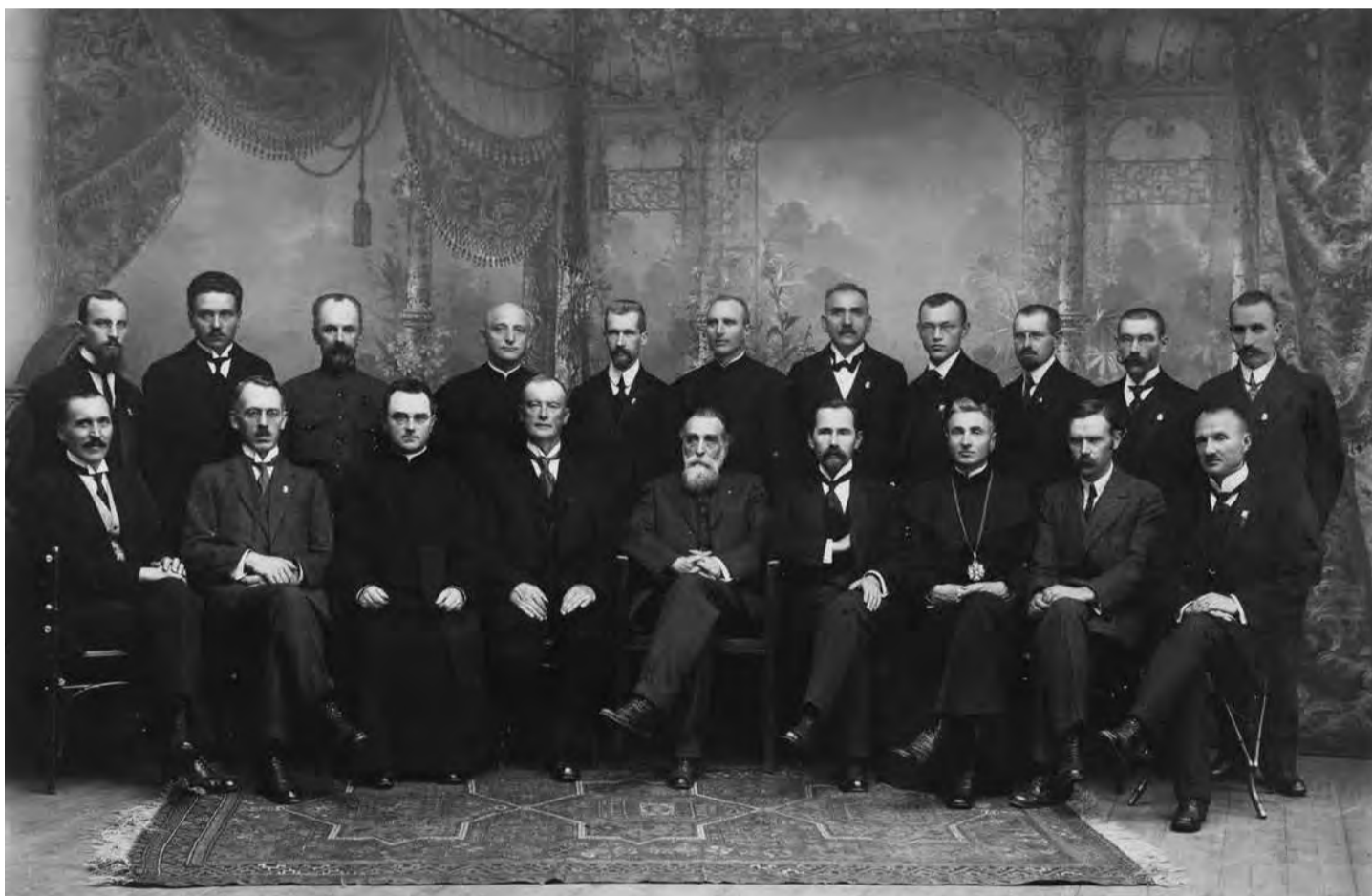
Lietuvos Taryba, pasirašiusi 1918 m. vasario 16 d. Valstybės Nepriklausomybės atkūrimo aktą. Sėdi (iš kairės): Jonas Vileišis, Jurgis Šaulys, Justinas Staugaitis, Stanislovas Narutavičius, Jonas Basanavičius, Antanas Smetona, Kazimieras Šaulys, Steponas Kairys, Jonas Smilgevičius. Stovi (iš kairės): Kazimieras Bizauskas, Jonas Vailokaitis, Donatas Malinauskas, Vladas Mironas, Mykolas Biržiška, Alfonsas Petrulis, Saliomonas Banaitis, Petras Klimas, Aleksandras Stulginskis, Jokūbas Šernas, Pranas Dovydaitis.