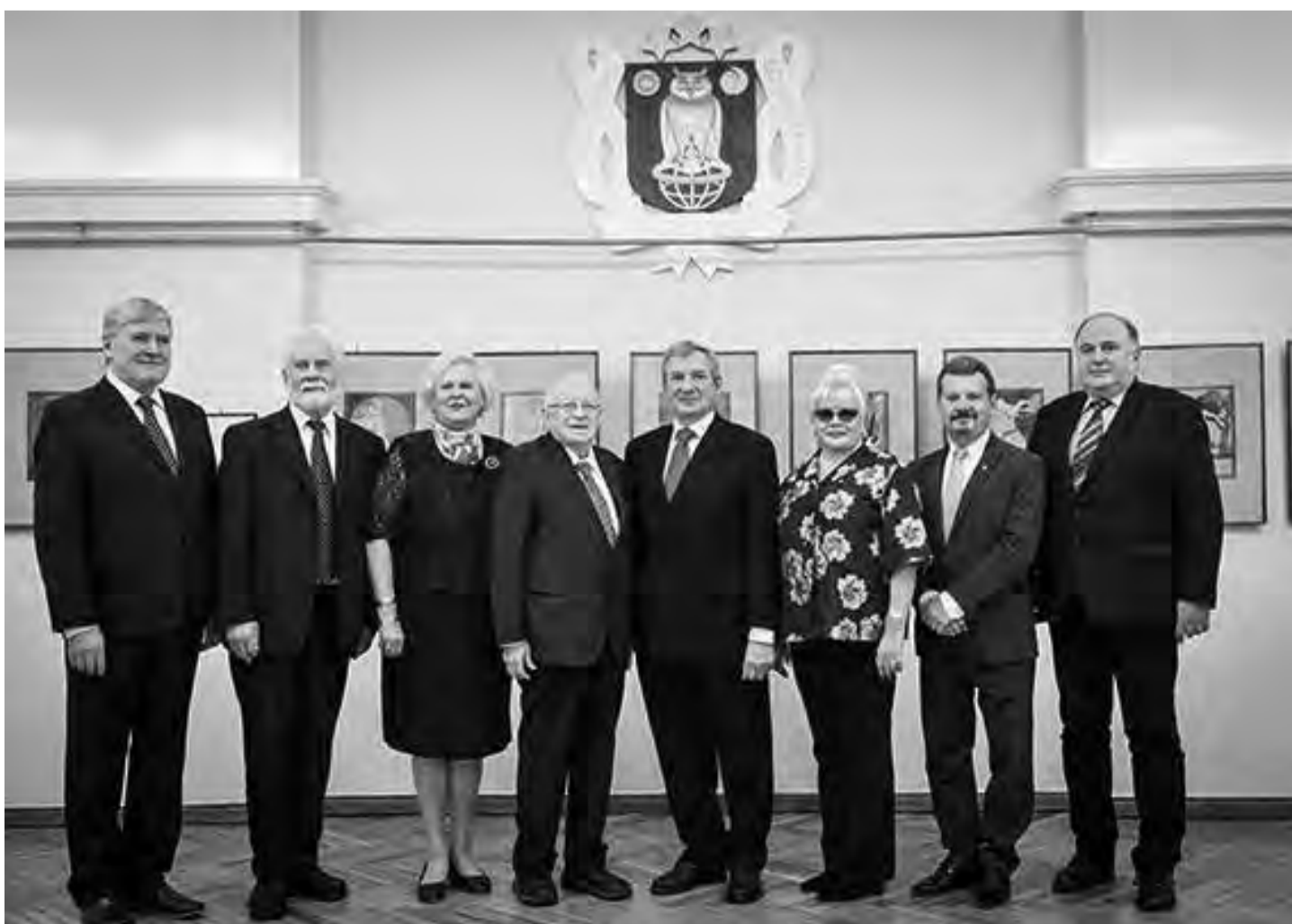
Boriso ir Inaros Teterėvų fondo premijos įteikimo dalyviai