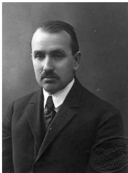
Prof. Pranas Dovydaitis Kaune (1932 m.).

Pranas Dovydaitis (1886 12 04 – 1942 11 02) šioje viloje ilsėdavosi 1925–1940 m. Teisininkas, filosofas, 1918 m. vasario 16-osios Nepriklausomybės akto signataras, Ministras pirmininkas, Kauno lietuviškos „Aušros“ gimnazijos direktorius, Vytauto Didžiojo universiteto profesorius, Ateitininkų federacijos vadovas, vienas pirmųjų Katalikų mokslų akademijos akademikų, žymus visuomenininkas, redaktorius ir leidėjas,