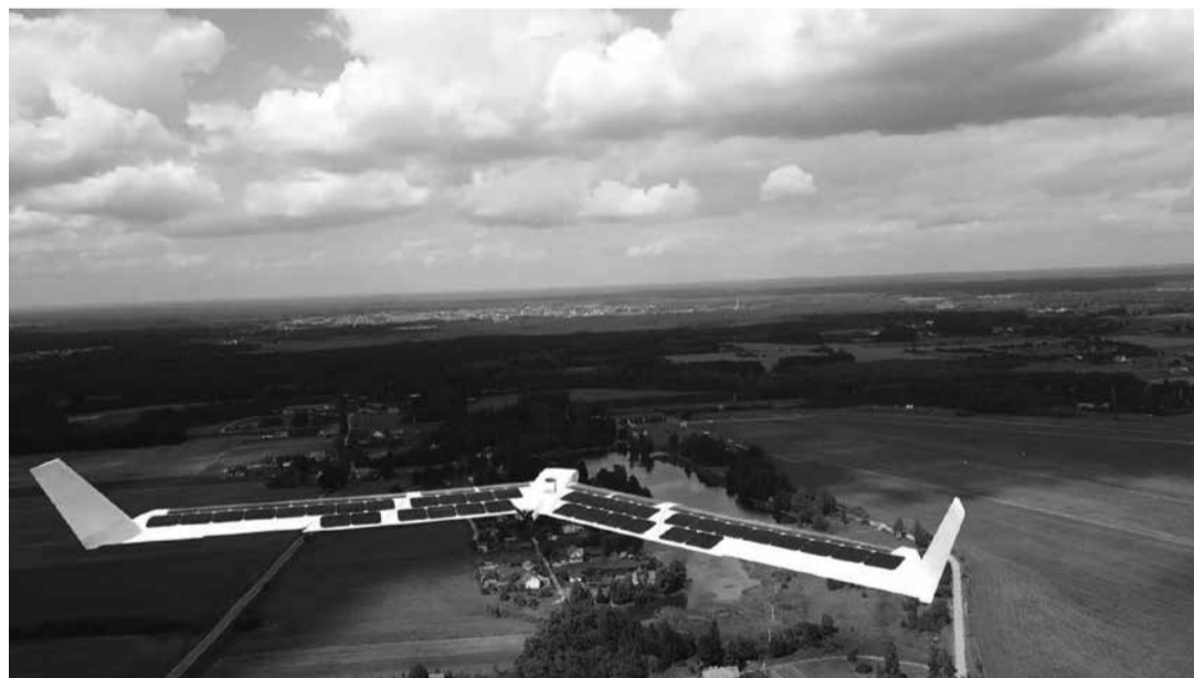
Saulės energija varomas bepilotis orlaivis.