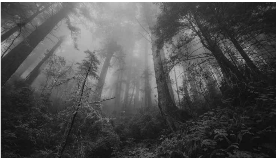
Nepakartojamas miško vaizdas.

Lietuvos nacionalinės mokslo programos „Agro, miško ir vandens ekosistemų tvarumas“ projektą „Plynyčių kirtimų poveikio miško ekosistemų biologinės įvairovės dinamikai tyrimai“ (Nr. SIT-1/2015) jau trejus metus vykdo ir koordinuoja Vytauto Didžiojo universitetas. Projekto partneriai – Vilniaus, Varšuvos universitetai bei Lietuvos agrarinių ir miškų mokslų centras. Sudėtingus, kompleksinius tyrimus vykdančios mokslininkai tikisi gauti finansavimą tolesniems tyrinėjimams dar bent keleriems metams, kadangi ekosistemų kaitai tirti reikia bent dešimtmečio. ■