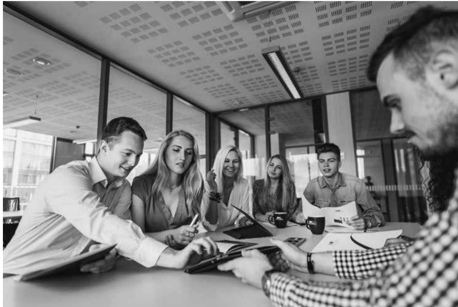
Studentai.