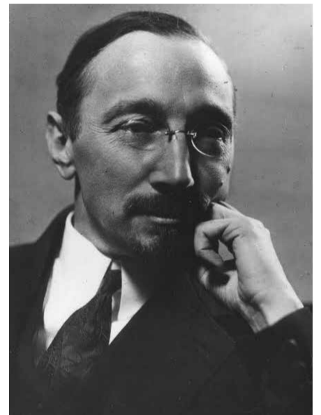
Prof. Stasys Šalkauskis (apie 1937 m.).