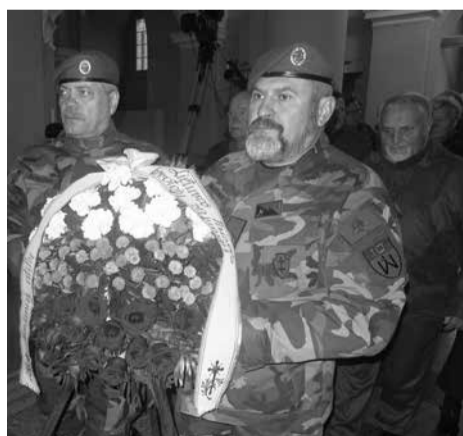
Gėlės Lietuvos kovų už laisvę vado atminimui.