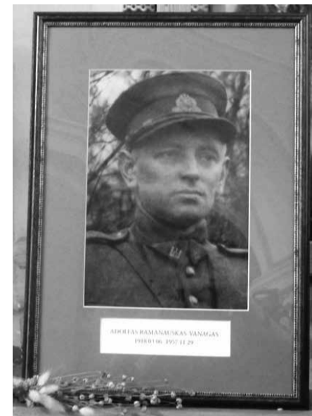
Adolfas Ramanauskas - Vanagas