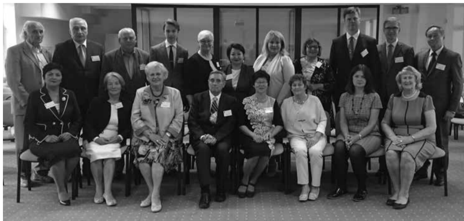
Konferencijos plenarinio posėdžio pranešimų autoriai su svečiais iš Latvijos, Kazachstano ir kitų universitetų

A tidžiai analizuojančius Švietimo ir mokslo ministrės veiksmus ir vertinančius, kodėl švietimo situacijos vertinimas visuomenėje nusirito į dar neregėtas žemumas, kodėl tiek pedagogų, tiek akademinėje bendruomenėje įsivyravo sumaištis, kviečiame sveitainėje https://www.peticijos.com pasirašyti „Peticiją dėl visuomenės solidarumo su Lietuvos mokytojais“.