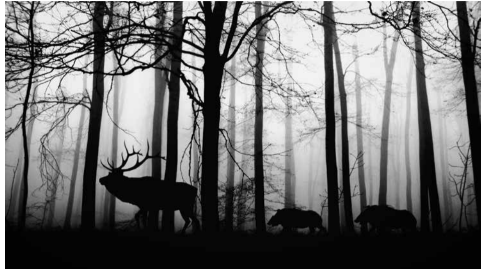
Miškas, pilnas gyvybės

Pramoniniuose miškuose einama paprastesniu keliu – tiesiog iškertama, suariama ir pasodinami nauji medžiai. Tačiau eks-