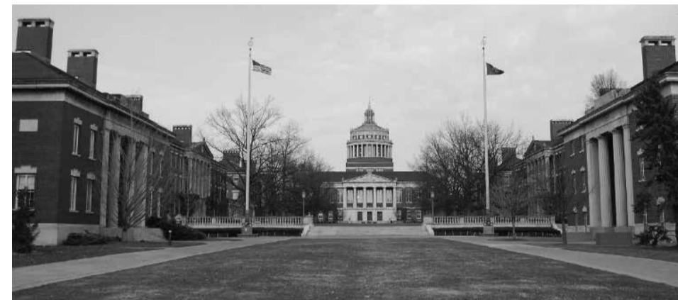
Ročesterio universitete (JAV, NY)