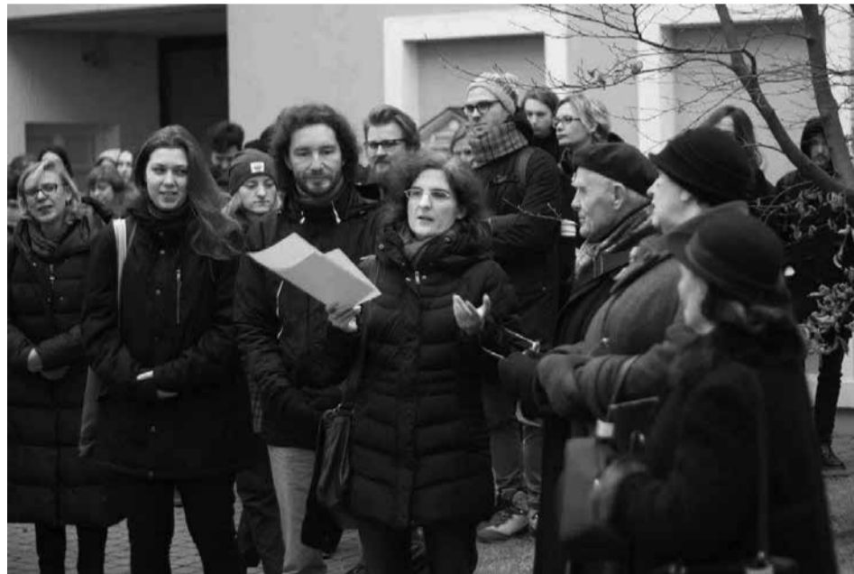
Dėstytojų protestus palaiko ir akademinis jaunimas