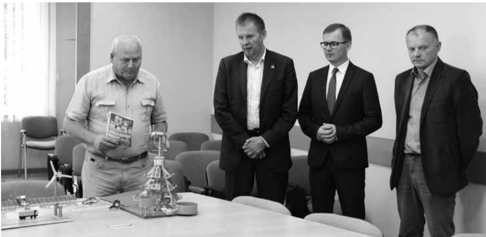
Išradimo pristatymas Tauragės rajono savivaldybėje

P. S. Sąvokos: „kapiliarinė energetika“ ir „hibridinis elektros energiją generuojantis vibrokontūras“ yra sukurtos šio teksto autoriaus. Išradimas patentuotas LR patentų biure. Ši techninė idėja paskelbta Europos patentų tarnyboje. Gauti autoritetingų Lietuvos mokslininkų atsiliepimai ir vertinimai.