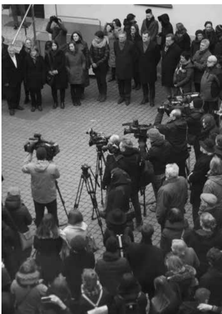
Protesto akcija Vilniaus universitete

G ruodžio 11 d. 10 val. Vilniaus universiteto Filosofijos ir Istorijos fakultetų langai buvo paženklinėti gedulo kaspinais. Sklido laidotuvių muzika. Taip Seimo nariams buvo siekiama perduoti žinią – nesiėmus veiksmų, aukštąjį mokslą teks laidoti. Gedulo akcija buvo priminimas jau kitą dieną (gruodžio 12-ąją) posėdžiausiantiems Seimo nariams, kad jie turi paskutinę galimybę atsižvelgti į aukštojo mokslo padėtį ir priimti valstybės biudžeto pataisas, užtikrinančias labiau adekvatų šios srities finansavimą.