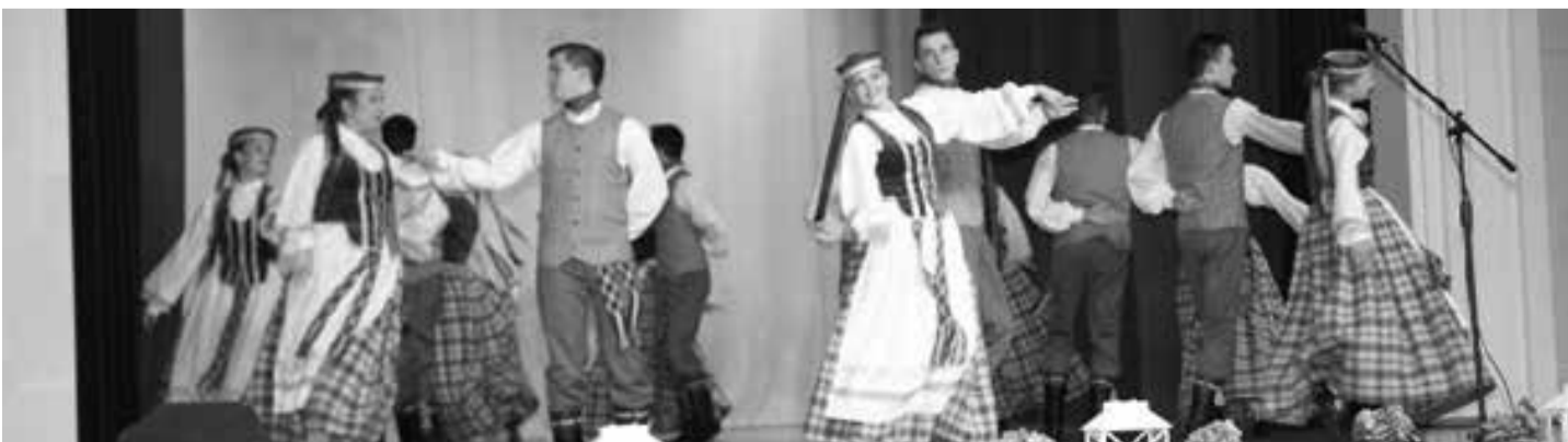
... ir tautinių šokių grupė.