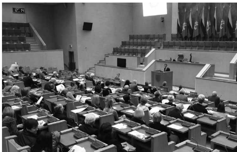
Konferencijos dalyviai Seime, Kovo 11-osios salėje