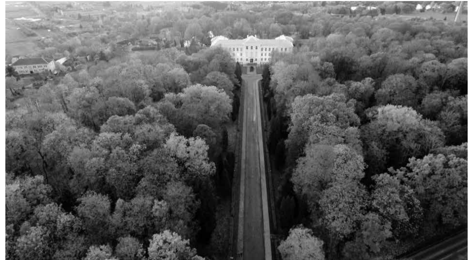
Akademijos miestelio vaizdas iš paukščio skrydžio