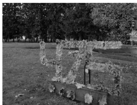
Pirmą kartą švenčiamas 475-asis miestelio gimtadienis