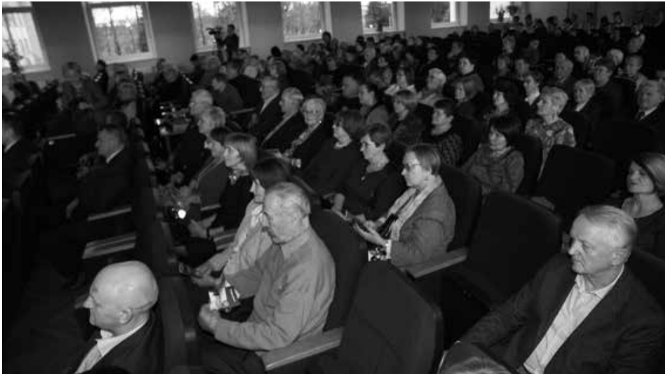
Iškilmingo susirinkimo dalyviai