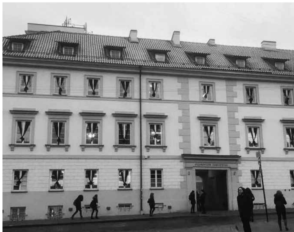
Gedulo juostos ant Vilniaus universiteto pastato

„Paskutinio prioriteto“ judėjimo konkretūs reikalavimai: